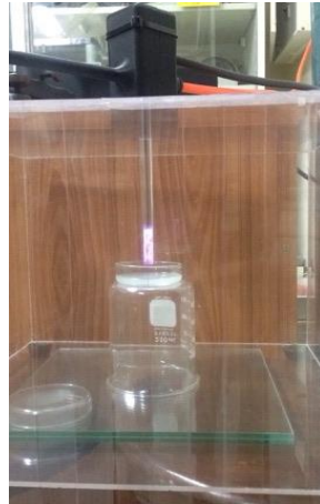
ภาพที่ 6 การฉายพลาสมาตามเงื่อนไขเวลา

ติดตั้งอุปกรณ์พลาสมาโดยกำหนดเงื่อนไขดังนี้ อัตราการไหลของแก๊สอาร์กอน 0.5 ลิตร/นาทีกำลังไฟฟ้าในการกำเนิดพลาสมา 40 วัตต์ระยะจากหัวเจ็ทถึงเชื้อรา 5 มิลลิเมตรอุณหภูมิห้องทดลอง 25 องศาเซลเซียส และความชื้นสัมพัทธ์ 51-53%และทำการฉายพลาสมาให้กับเชื้อราตามเงื่อนไขเวลา โดยกำหนดตัวอย่างควบคุม เงื่อนไขเวลา 2, 4, 6, 8 และ 10 นาที โดยใช้เชื้อราบริสุทธิ์ในการทดลองเงื่อนไขละ 3 plate ดังภาพที่ 6 จากนั้นบ่มเชื้อราไว้ที่อุณหภูมิแวดล้อม