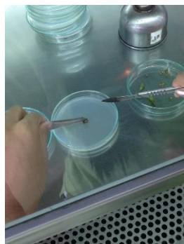
ภาพที่ 2 การวางพริกที่เป็นโรคแอนแทรคโนสใน Plate PDA

นำพริกที่เป็นโรคแอนแทรคโนส (โรคกุ้งแห้ง) มาล้างทำความสะอาด ตัดผลพริกส่วนที่เป็นโรคกุ้งแห้งแล้วผ่านน้ำเมสตีคอก จากนั้นนำผิวของผลพริกส่วนที่เป็นโรคกุ้งแห้งวางบนอาหาร PDA เลี้ยงไว้ 48 ชั่วโมง ที่อุณหภูมิห้องดังภาพที่ 2