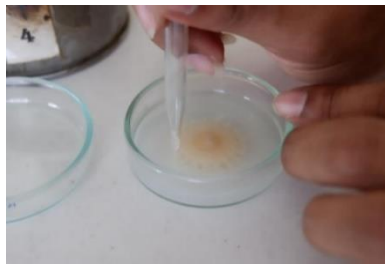
ภาพที่ 4 การกำหนดขนาดเริ่มต้นของเชื้อราโดยการใช้ Dropper