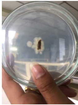
ภาพที่ 3 เชื้อรา Colletotrichum spp. จากผลพริก

สังเกตการงอกของเชื้อราที่เลี้ยงไว้แล้วเลือกส่วนที่เป็นเชื้อรา Colletotrichum spp. (มีลักษณะเป็นสีส้ม) ดังภาพที่ 3 จากนั้นนำเข็มเย็บปลายงอมาฆ่าเชื้อโดยการนำไปเผาไฟ เชี่ยวส่วนปลายเส้นใยเชื้อราไปวางใน plate อาหาร PDA แล้วเลี้ยงไว้ 48 ชั่วโมง หลังจากนั้นจะทำการแยกเชื้อราบริสุทธิ์ลง plate เพื่อใช้ในการทดลอง โดยใช้ด้านปลายของหลอดหยด (Dropper) จิ้มบริเวณปลายเส้นใยของเชื้อราเพื่อกำหนดขนาดเริ่มต้นของเชื้อราในการทดลอง ดังภาพที่ 4 และใช้เข็มเย็บ เชี่ยวเชื้อราที่จิ้มไว้ไปวางคว่ำใน plate ที่ต้องการทดลอง จำนวน 18 plate ดังภาพที่ 5